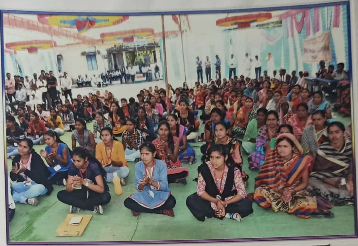
श्री.बिश्वा कार्यक्रमात गावकऱ्यांचा सहभाग