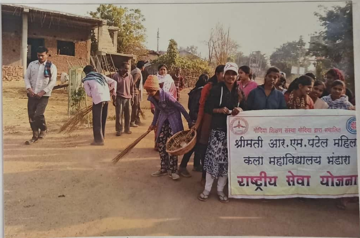
दत्तक ग्राम सिजेपार(झं) येथे शिकिरी ग्राम स्वच्छता करताना