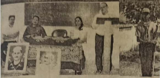
आर.एम.पटेल महिला महाविद्यालय