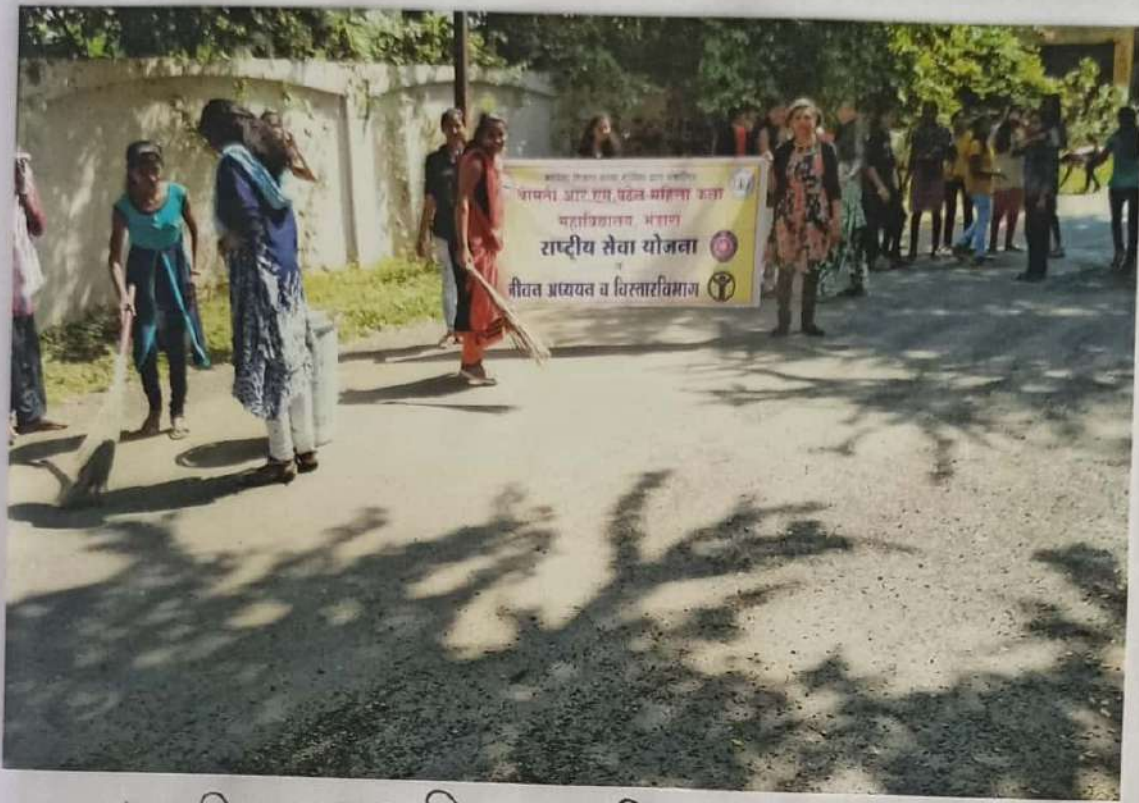
महाराष्ट्र शासन, महाराष्ट्र शासकीय महाविद्यालय, भंडारा राष्ट्रीय सेवा योजना जीवन प्रचल्यत व विस्तारविमान