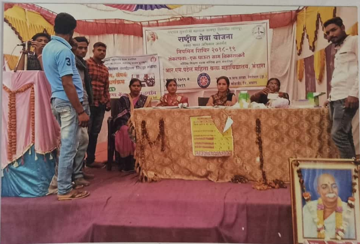
सिकलसेल जनजागृती व तपासणी करताना ग्रामवासी