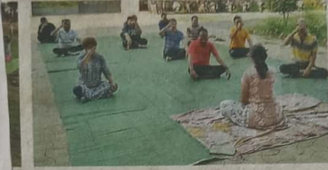
आर.एम. पटेल महिला महाविद्यालय, भंडारा