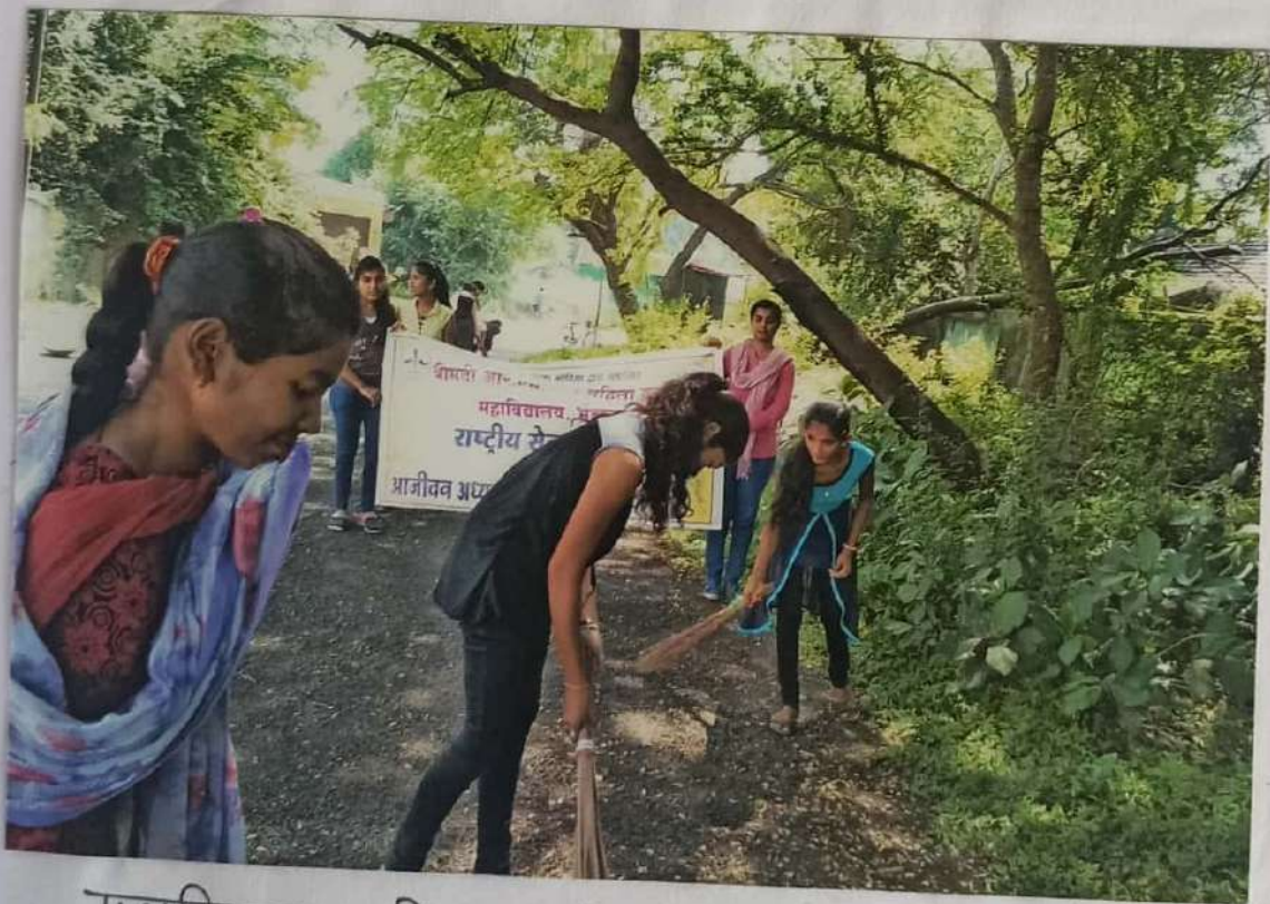
महाराष्ट्र शासन, महाराष्ट्र शासकीय महाविद्यालय, भंडारा राष्ट्रीय सेवा योजना जीवन प्रचल्यत व विस्तारविमान ३० सप्टें २०१८