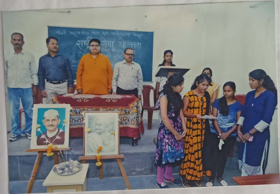
२ ऑक्टो २०१८ महात्मा जयंती व जलच्छादर शाली जयंती = जागतिक झालिवा दिन