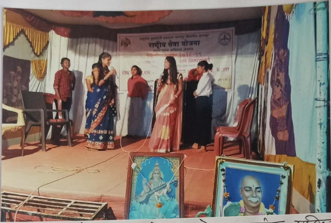
शिविराच्या सांस्कृतिक कार्यक्रमात प्रवेशन करताना नाटिका सादर करताना शिविराची