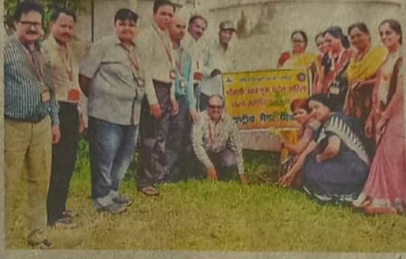
आर.एम. पटेल महाविद्यालय, भंडारा

रासेयो विभागाच्या वृक्षारोपणाच्या मार्गदर्शन केले.