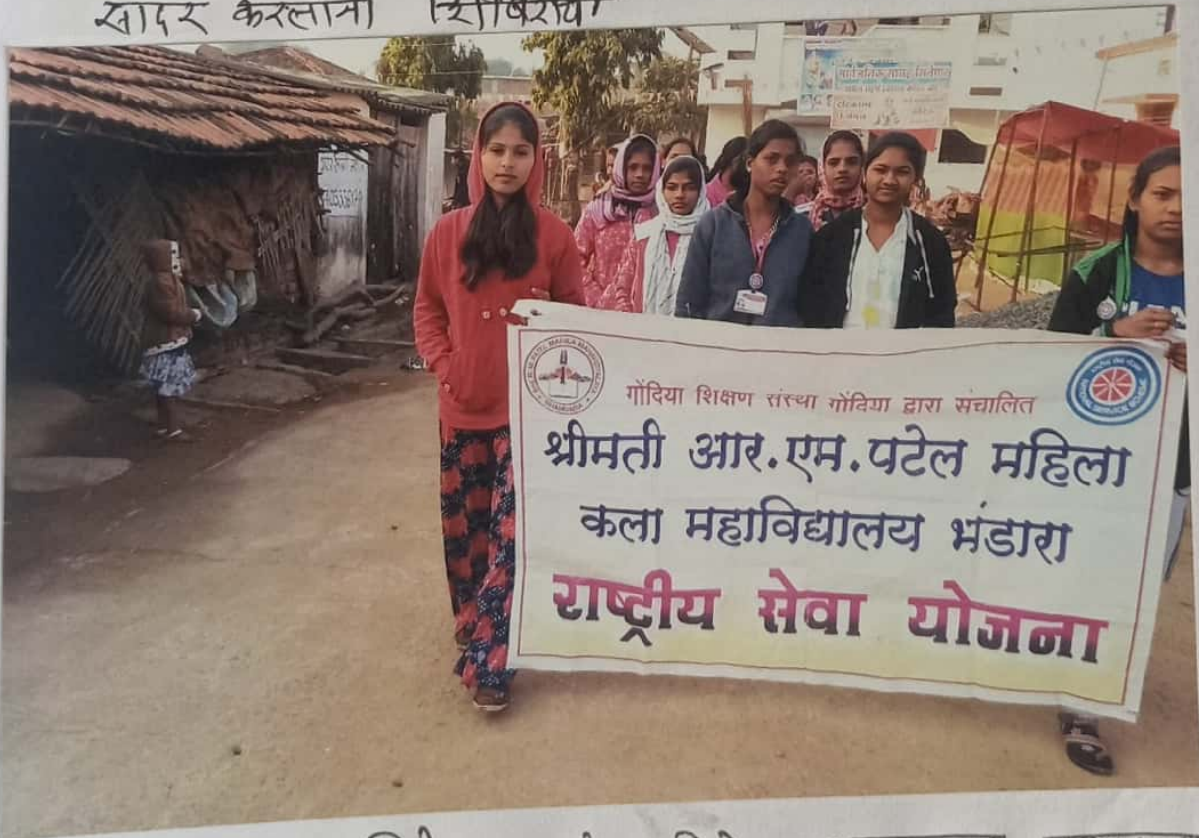
दुसक गाव सिनेपार (इं) येथे गावात प्रभात फेरी काढताना शिविराची स्वयंसेविका.