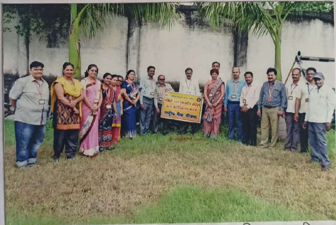
५ जुलै २०१८ वृक्षारोपण कार्यक्रमात सहविद्यालयातील आस्थापक प्रबंधक व शिक्षकसंरक कर्मचारी